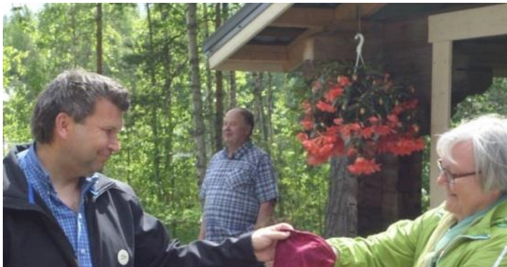
Esimerkki aidossa tilanteesta otetusta kuvasta.

Kannattaa myös hyödyntää paikallista osaamista ja kysellä mm. Heinolan Kameraseurasta, olisiko heillä joku joka olisi kiinnostunut tarjoamaan kuviaan ja/tai kuvausapua.